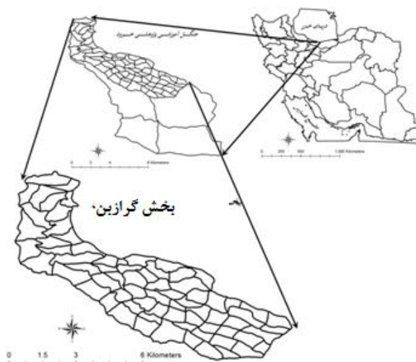
شکل ۱- موقعیت جغرافیایی منطقه مورد مطالعه.